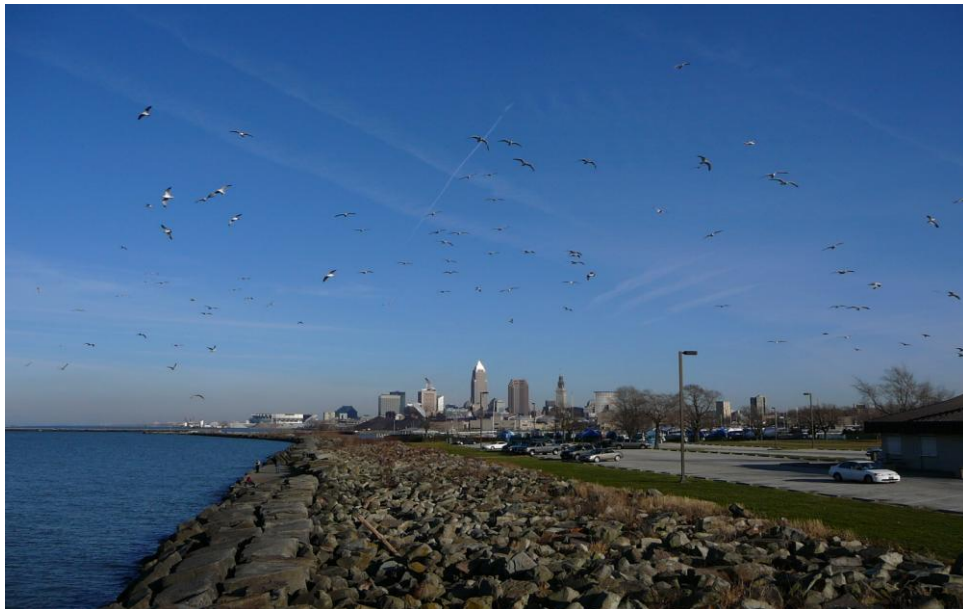
Lake Erie und die Skyline von Cleveland