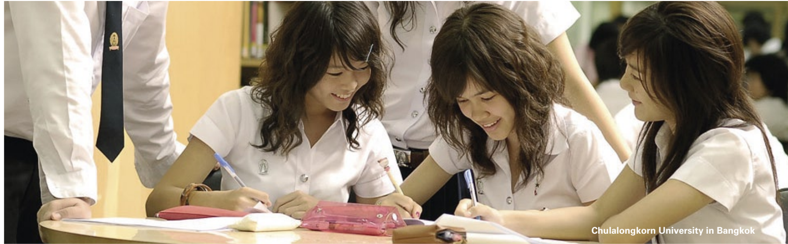
Chulalongkorn University in Bangkok

Der Fachbereich Wirtschaftswissenschaften hat eine neue Kooperation mit der renommierten Chulalongkorn University in Bangkok geschlossen. Die private Universität wurde vor fast einem Jahrhundert als erste Universität Thailands gegründet; heute sind in 41 Fakultäten insgesamt 32.511 Studierende in einem Bachelor-, Master- oder Doktorandenstudium eingeschrieben.