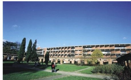
Université Toulouse 1 Capitole

Vor allem der Fachbereich Wirtschaftswissenschaften hat seit seiner Entstehung in den 1960er-Jahren eine internationale Reputation aufgebaut: Sowohl Lehre als auch Forschung der Universität Toulouse genießen weltweit hohes Ansehen. Laut The Journal of Socio-economics ist die UT1 im Bereich Wirtschaftswissenschaften die Nr. 2 in Frankreich.